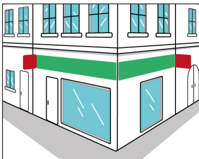
..... Illustration de la règle

Dès que la configuration le permet, elle doit être installée dans l'alignement de l'enseigne parallèle.